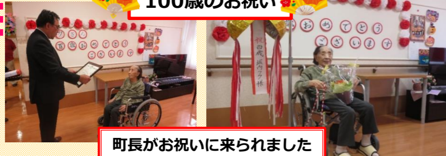
町長がお祝いに来られました